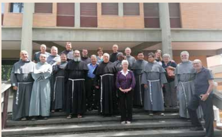
Alcuni momenti assembleari e la foto di gruppo