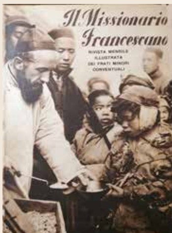
Il primo numero gennaio 1933