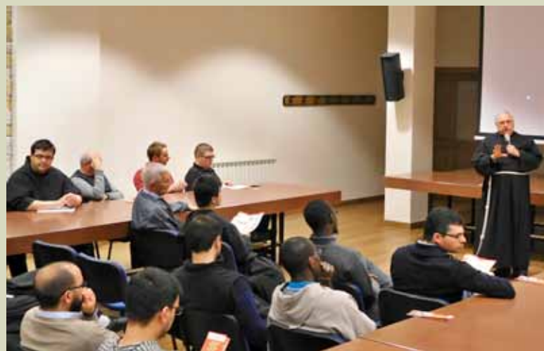
Al Seraphicum di Roma