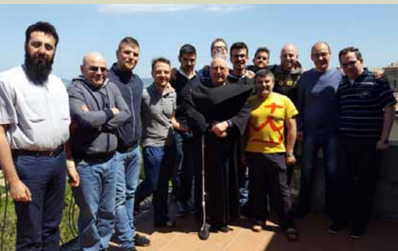
Con i Postulanti di Osimo

I vari incontri sono stati un'occasione di animazione ad intra e ad extra, di conoscenza delle realtà e del ruolo del Centro che si relaziona quotidianamente con i luoghi missionari e soprattutto di raccontare le esperienze che il Centro stesso porta avanti durante l'anno con le varie iniziative di animazione: l'Assemblea annuale, la testimonianza di evangelizzazione sul Tevere e le singole iniziative degli Animatori all'interno delle proprie giurisdizioni. (P. F.)