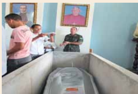
Mons. Luigi D'Andrea riposa nella cattedrale della sua Diocesi in Brasile.