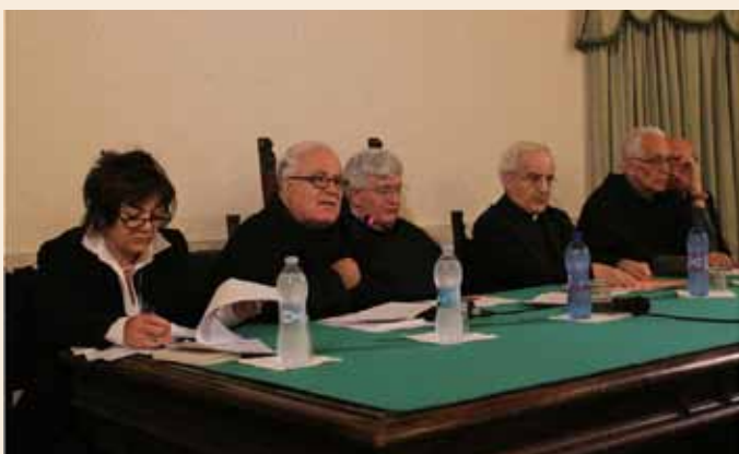
La presentazione del libro ai SS. Apostoli - Roma.