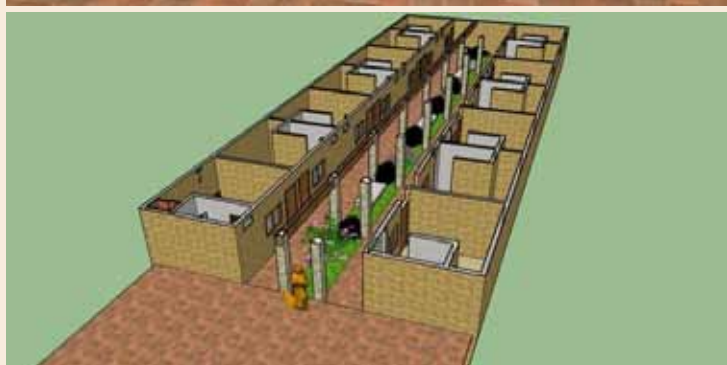
Il progetto del costruendo Centro di Evangelizzazione in Paraguay. (Costo previsto Euro 100 mila)