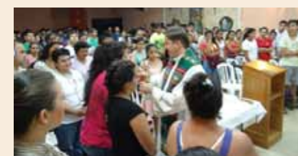
La fiorente attività dei nostri confratelli.