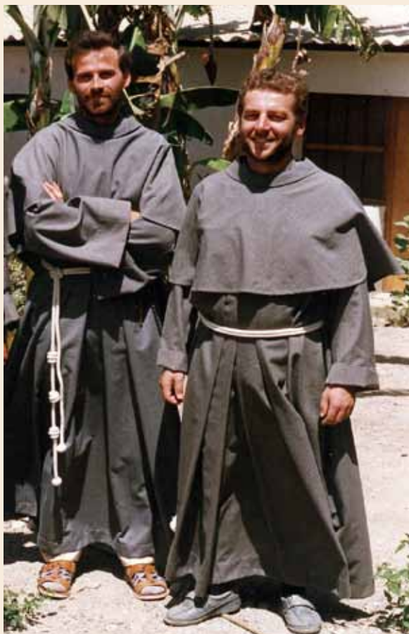
I due martiri polacchi

Martedì 8 Dicembre: Ore 20 Eucaristia di ringraziamento nella cattedrale Di Lima, presieduta dal Card. Juan Luis Cipriani