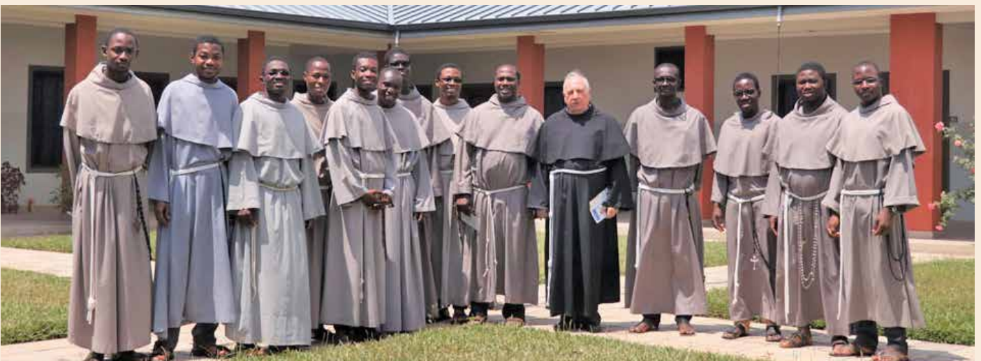
Con i 12 novizi a Saltpond in Ghana.