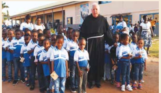
Con i bambini dell'asilo nella scuola di Sunyani in Ghana.