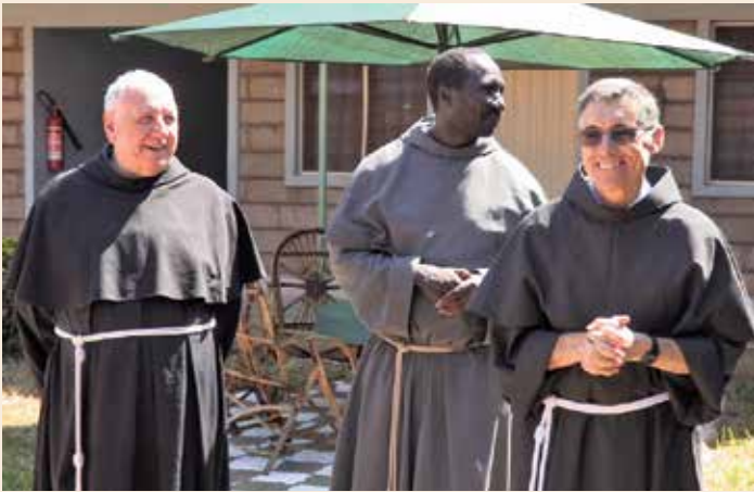
Con il Ministro Generale in visita alla scuola di Ruiri-Kenya.