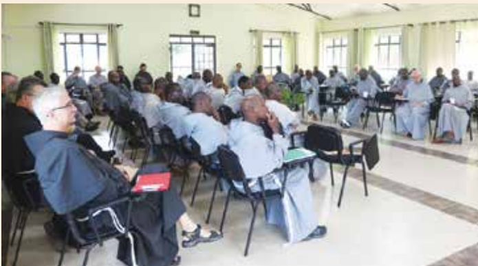
L'aula capitolare durante il primo Capitolo Prov. del Kenya.