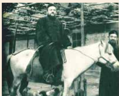
LA VIA FRANCESCANA DELLA SETA 方济会丝绸之路

Dopo il recente viaggio del Direttore del Centro in Cina nello scorso mese di maggio, è stato realizzato un docu-film sulla storia e la presenza dei Frati Minori Conventuali nella grande nazione della Cina. Il docu-film prodotto dal Centro Missionario racconta l'inizio della presenza dei Conventuali, quando nel 1925 su invito di Papa Pio XI partirono i primi 8 frati dall'Italia per evangelizzare quella terra. Nei 25 anni della loro presenza realizzarono molte attività costruendo chiese, seminari e opere sociali. Con i cambiamenti politici nel 1951 i frati furono espulsi nella loro patria e dopo un trentennio, tramite il compianto Fr. Matteo Luo, il seme gettato ha prodotto i suoi frutti con diversi giovani cinesi che hanno studiato in Italia. Oggi vivono in Cina, collaborando con i Vescovi locali. Il