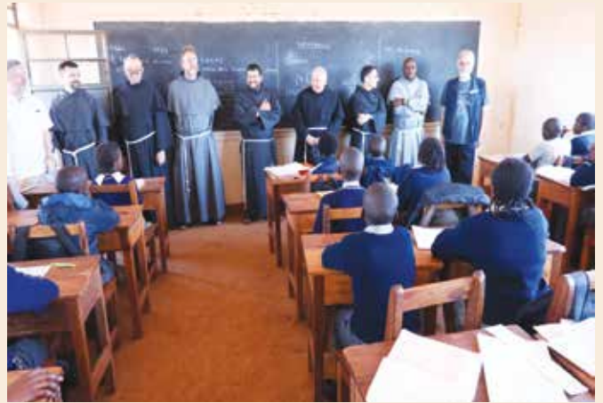
In un'aula scolastica dei 300 alunni di Ruiri-Kenya